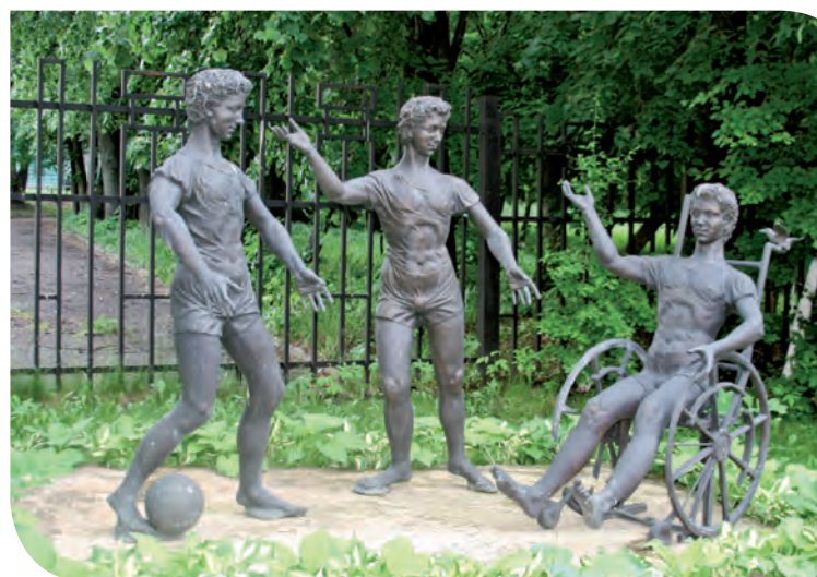
На базе ГАУ «Научно-практический центр медико-социальной реабилитации инвалидов» на Лодочной создается межведомственная городская Служба раннего вмешательства – как основа профилактики инвалидности у детей