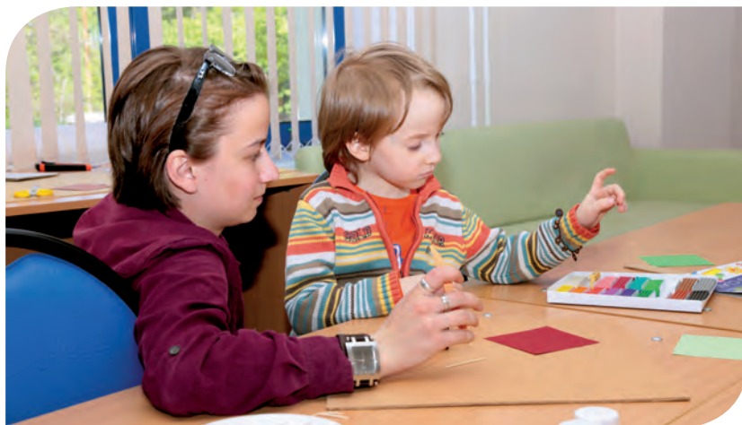
Развитие моторики пальцев с помощью лепки из пластилина

ком, – большое зеркало: оно необходимо для артикуляционных упражнений, правильной постановки и тренировки звуков. Глядя на себя в зеркало, мальчуган лет четырех повторял за логопедом движения языком влево-вправо – такое упражнение помогает разрабатывать речевой аппарат. Похоже на веселую игру, но на самом деле – всё серьезно!