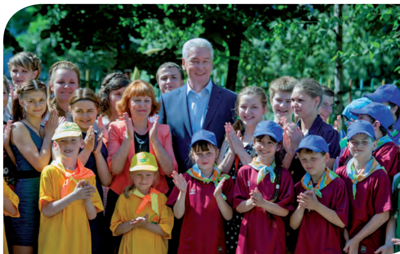
Мэр Москвы С.С. Собянин в гостях у воспитанников ЦРЦ для несовершеннолетних «Отрадное»

– На 900 детей уже готовы видеопортфолио и видеоролики, – отметил руководитель Департамента