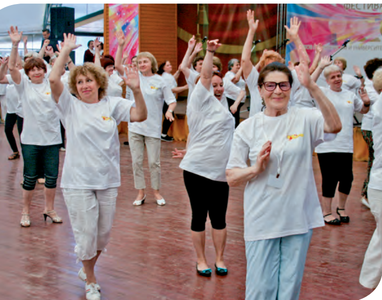
Физкультурный флешмоб от клуба «СуперБабушка»

Окончательные результаты соревнований между округами будут известны в ноябре, после череды других испытаний.