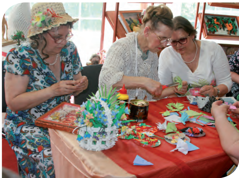
Мастер-класс рукодельниц для гостей фестиваля