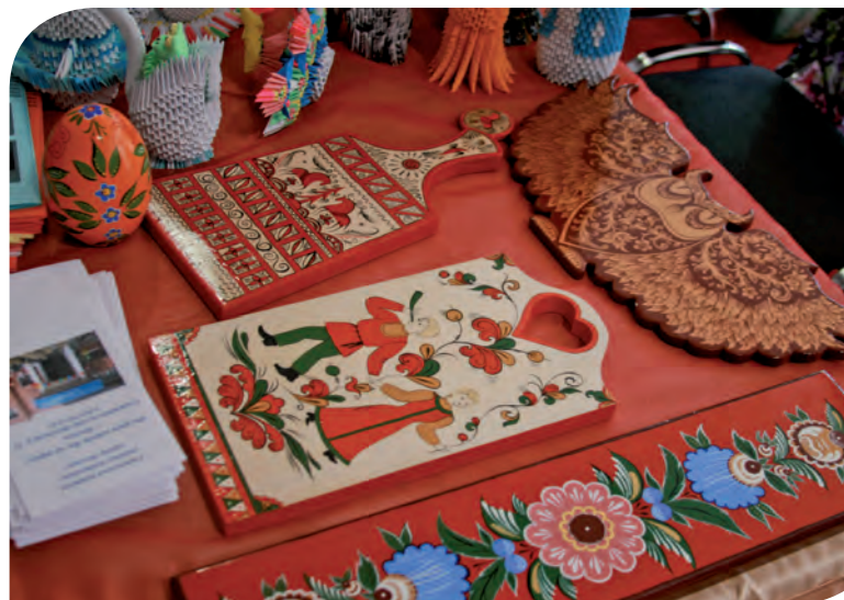
Образцы декоративно-прикладного творчества посетителей центров социального обслуживания